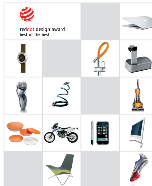
Herausragende Produkte ...

Nur etwa 1% aller Anmeldungen wird mit dem red dot design award: best of the best ausgezeichnet.